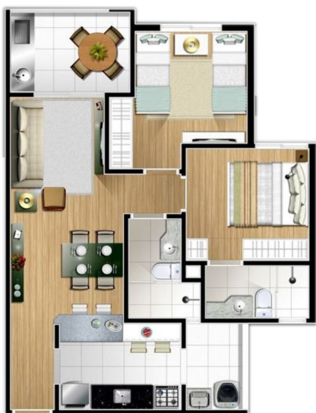
PERSPECTIVA ILUSTRADA DA PLANTA DO APARTAMENTO