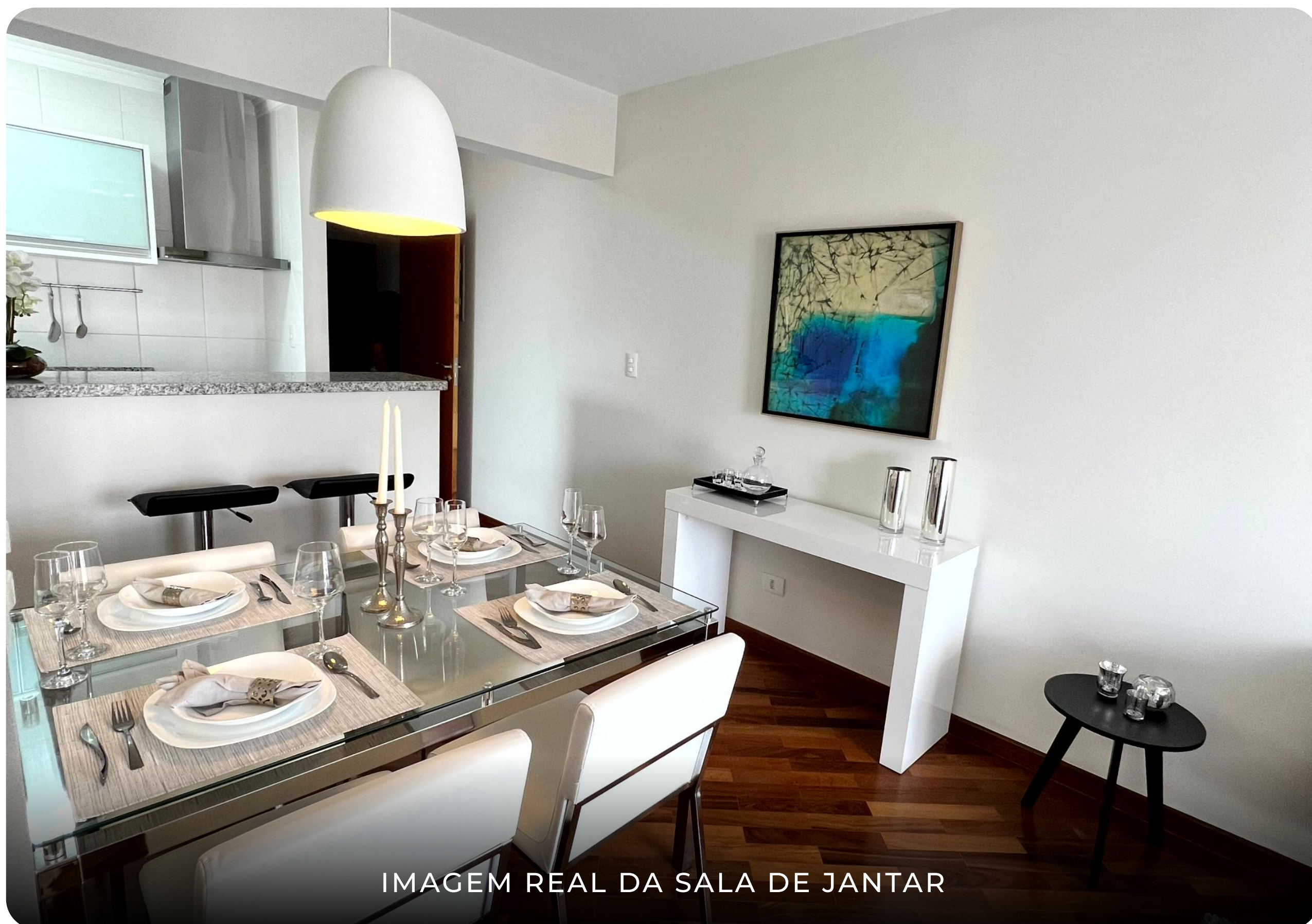
IMAGEM REAL DA SALA DE JANTAR