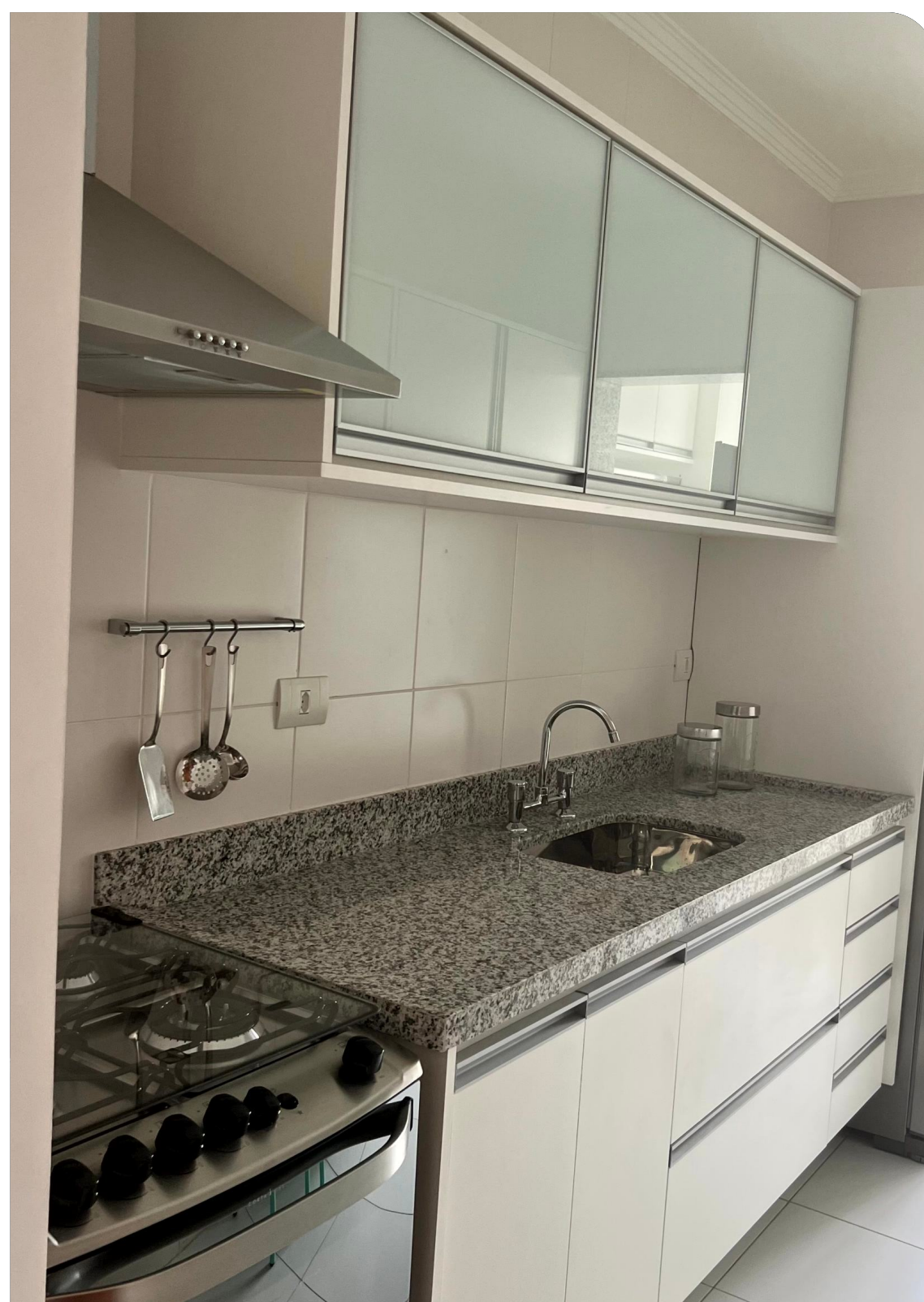
IMAGENS REAIS DO BANHEIRO E DA COZINHA, ENTREGUES COM PASTILHAS DECORATIVAS E BANCADAS EM GRANITO

O empreendimento oferece uma série de diferenciais que o tornam uma escolha excepcional para quem busca conforto e praticidade.