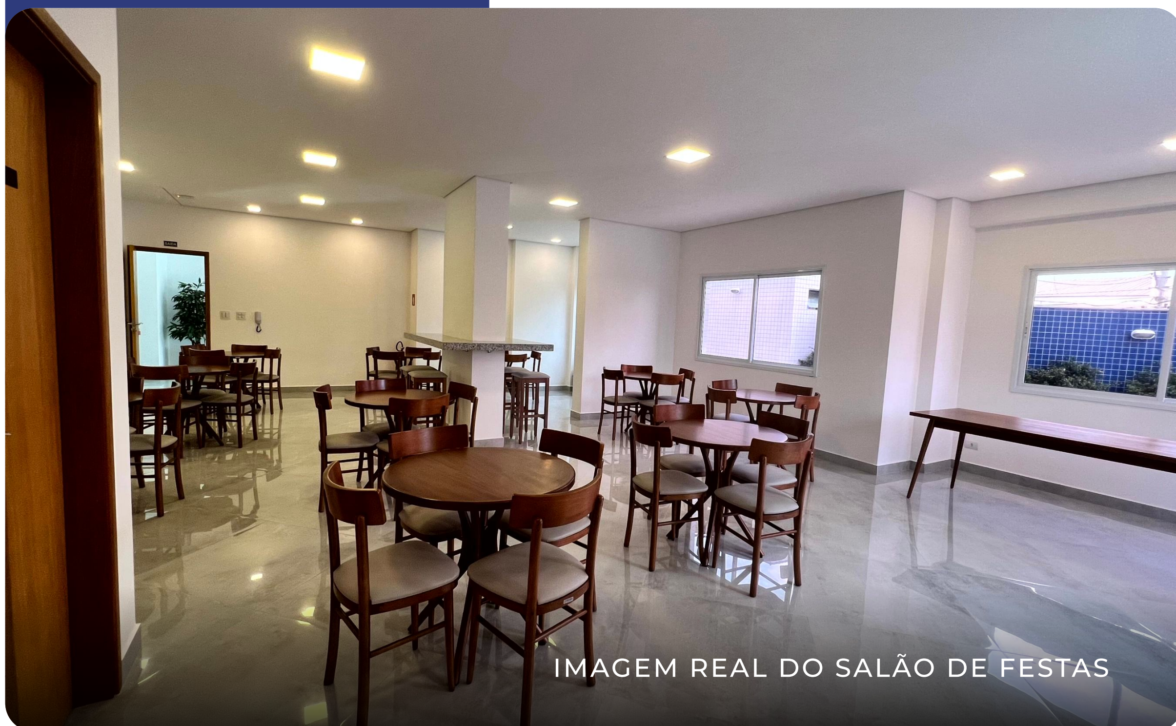
IMAGEM REAL DO SALÃO DE FESTAS

Para celebrar os momentos mais especiais da sua vida