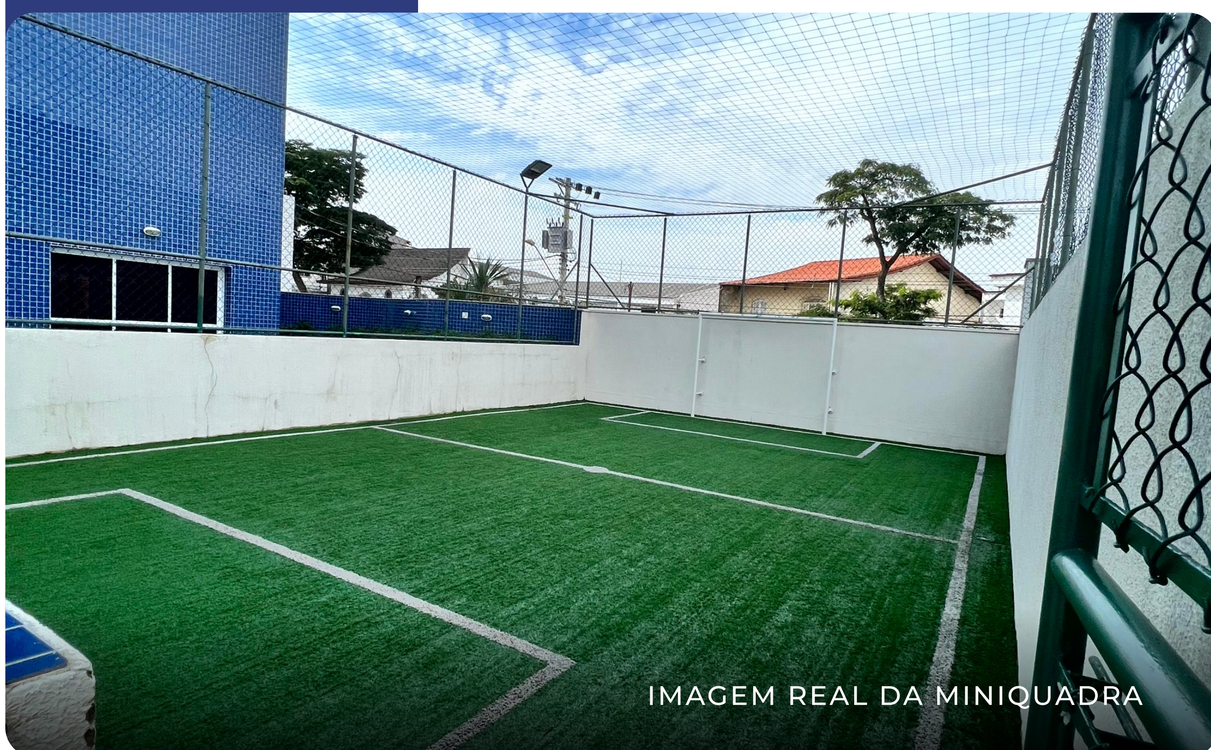
IMAGEM REAL DA MINIQUEADRA

Espaço para atividades esportivas e recreativas