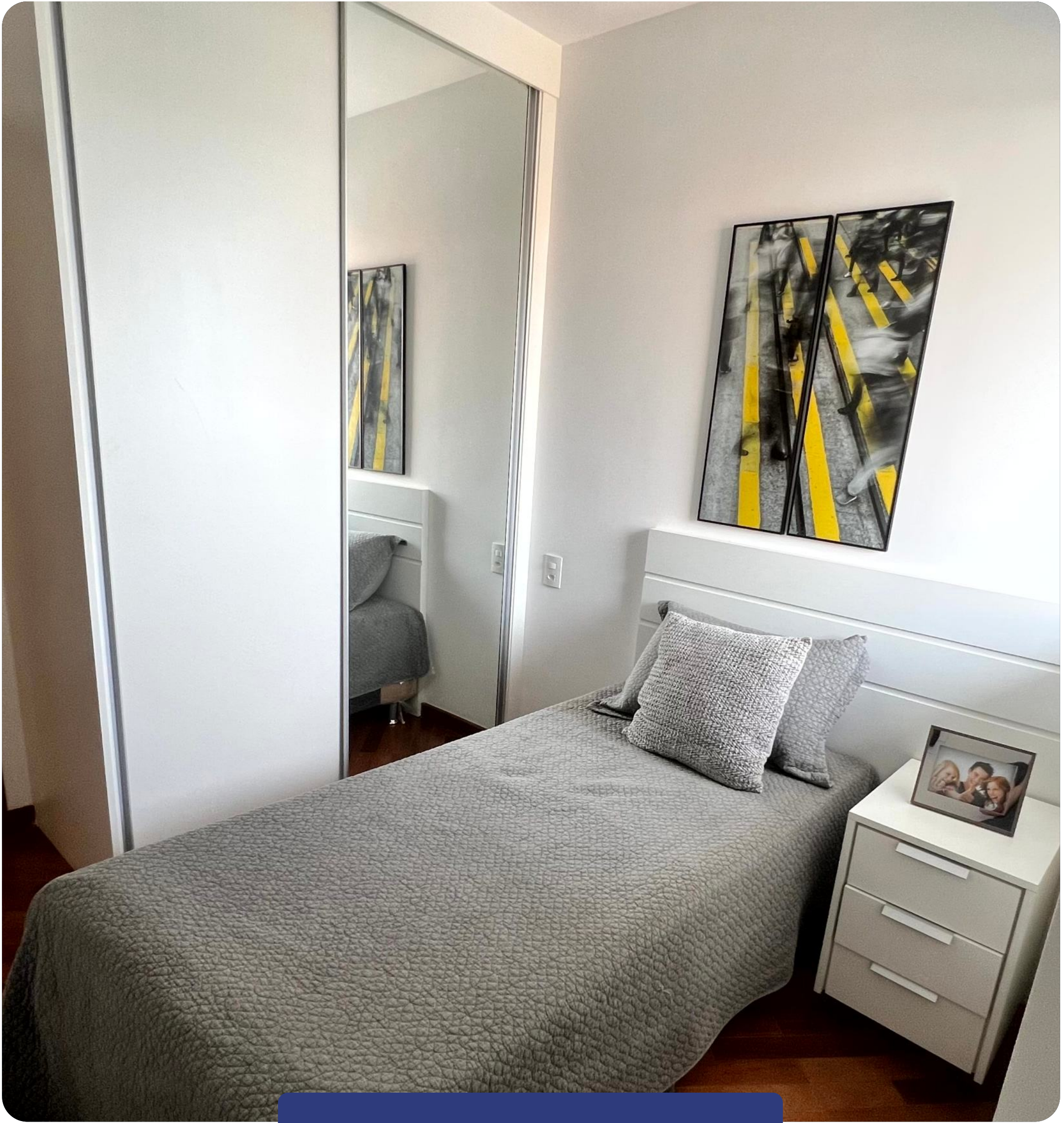
QUARTOS DE SOLTEIRO