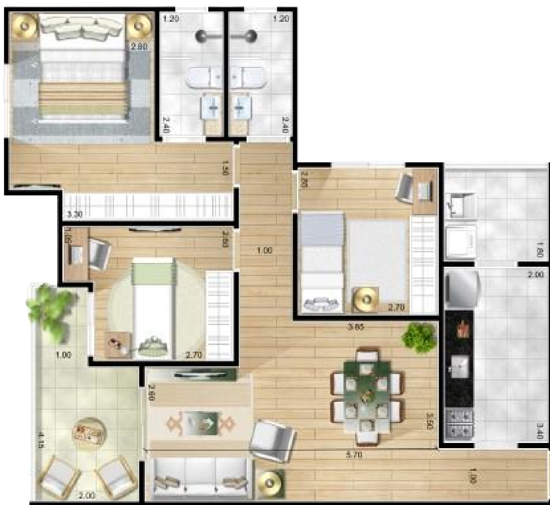
PERSPECTIVA ILUSTRADA DA PLANTA DO APARTAMENTO

espaços inteligentemente planejados para aproveitar cada metro quadrado