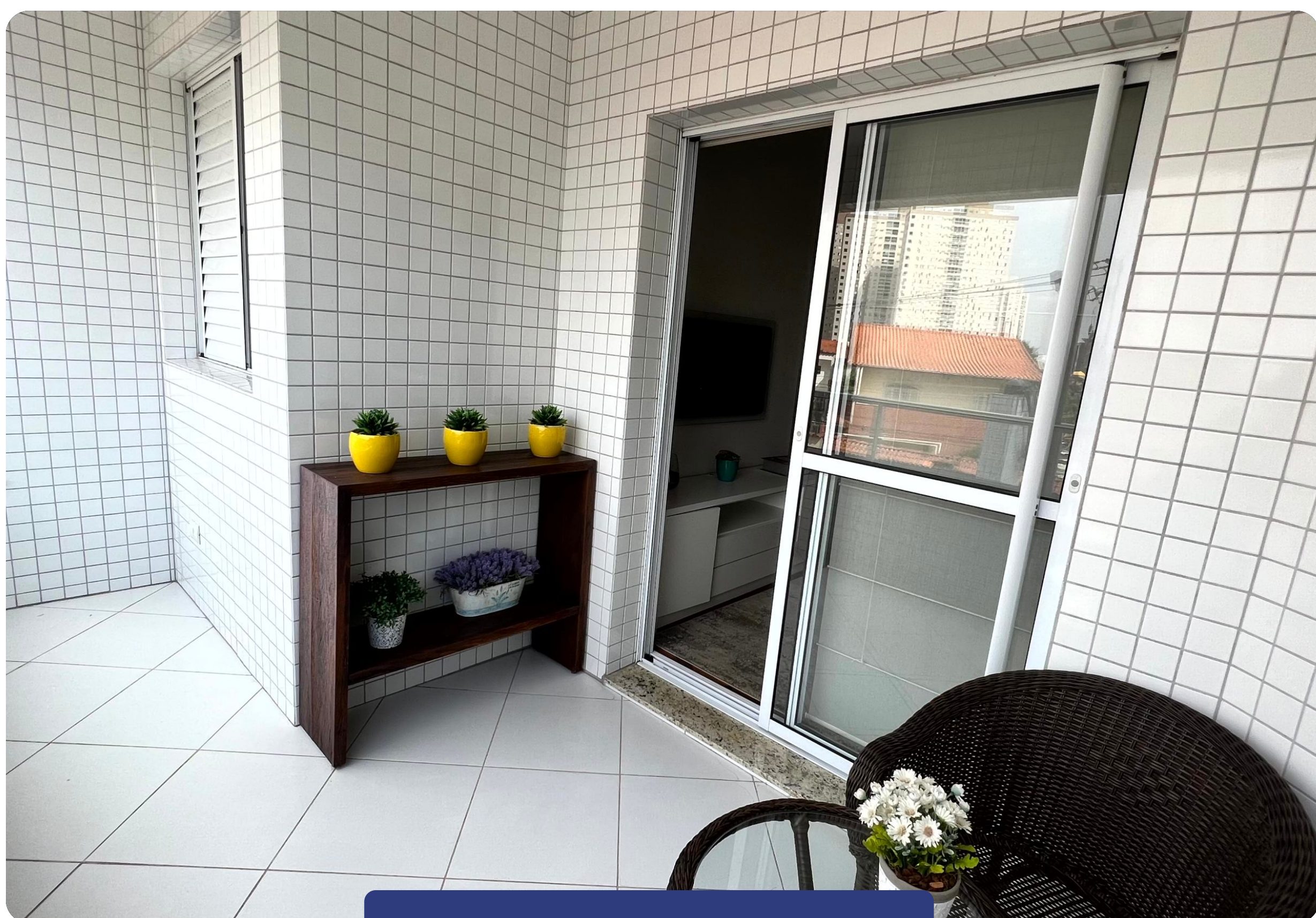
VARANDA E SUÍTE